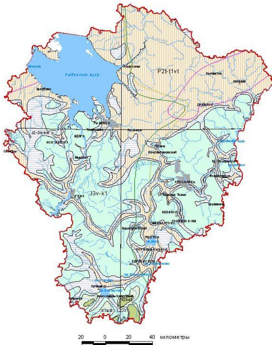
Гидрогеологическая карта Ярославской области (воды мезозойских, палеозойских и докембрийских отложений)